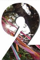
Lauréat des MUses.lux 2020 - Prix du projet méditerranéen Le collectif des Ateliers et le Centre culturel (Palais de la Neuve)

La Maison de l'urbanisme Famenne-Ardenne vous présente ses meilleurs vœux pour l'année à venir