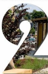
Lauréat des MUses.lux 2020 - Prix de l'espace public La Ville de Saint-Hubert pour la rénovation urbaine du Centre-Ville Architecte de paysage : Lucille Brin et l'atelier orange