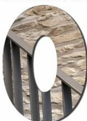
Lauréat des MUses.lux 2020 - Prix de l'édifice La commune de Tanneville pour la rénovation de la Maison de village de Cens Architecte : Étienne Barbeau